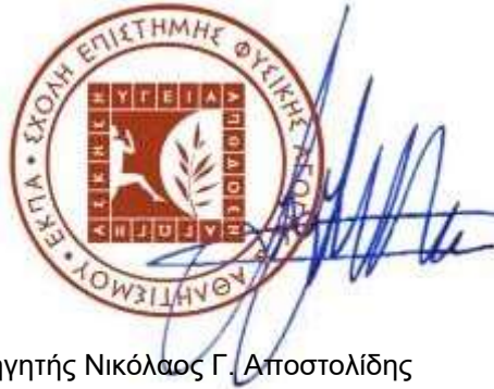
Καθηγητής Νικόλαος Γ. Αποστολίδης